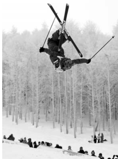
モーグル競技の華麗なエア

世界最高峰の華麗な技とスピードを大迫力の生で観戦できる絶好の機会です。皆さんも是非、会場にお越しください。