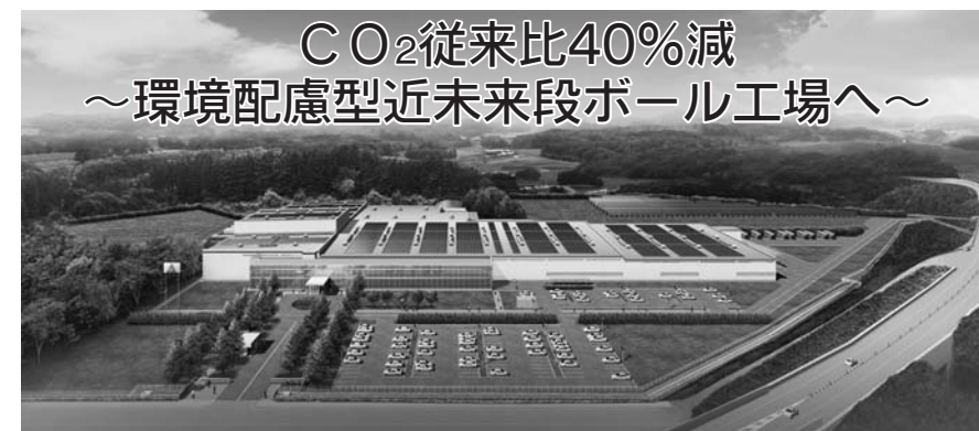
CO 2 従来比40%減 ～環境配慮型近未来段ボール工場へ～