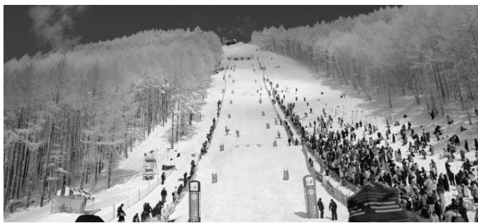
モーグル・デュアルモーグル会場 (リステルスキーファンタジア)