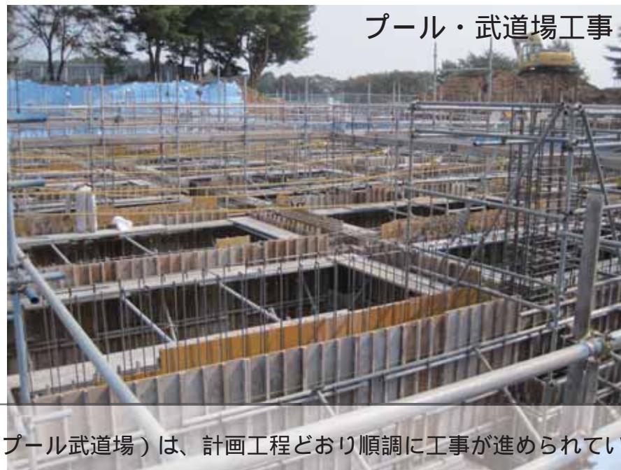
プール・武道場工事

平成 23 年度の矢吹中学校改築事業（校舎 期の保健室・家庭科室及びプール武道場）は、計画工程どおり順調に工事が進められています。 10月11日現在、基礎や地中梁の配筋工事、型枠工事が行われています。