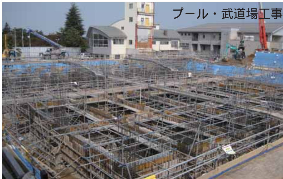
プール・武道場工事