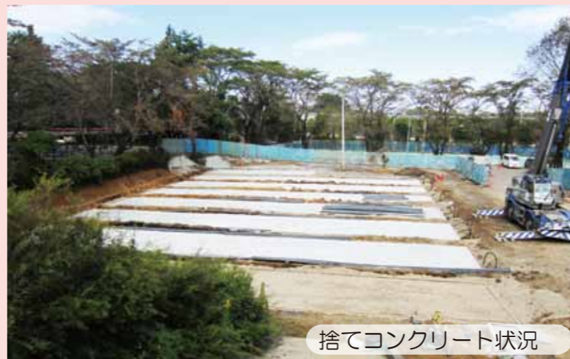
捨てコンクリート状況