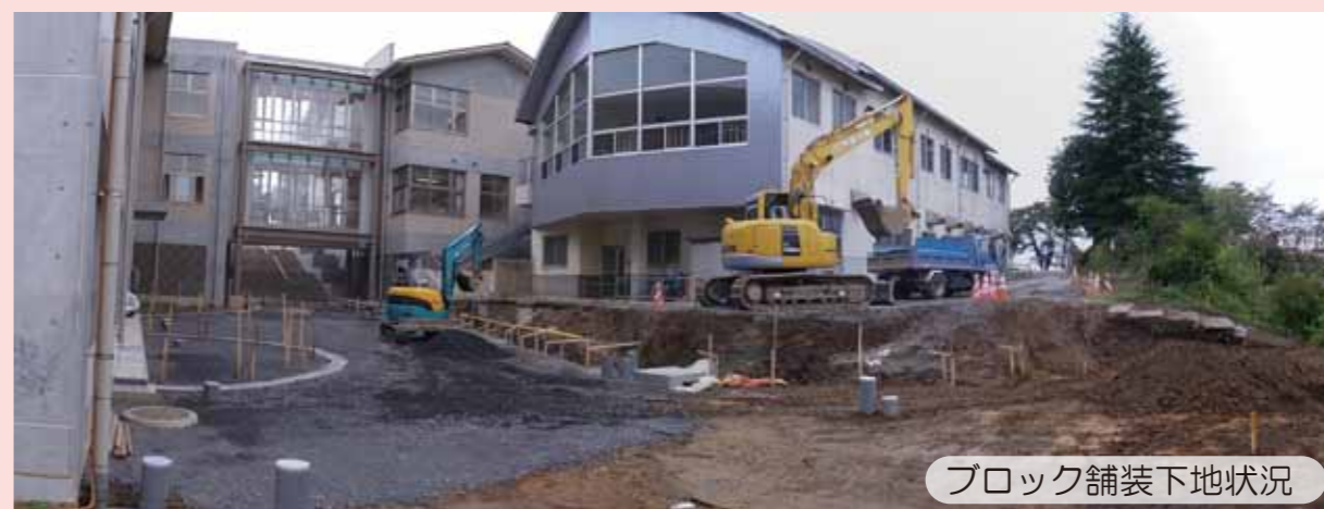
ブロック舗装下地状況