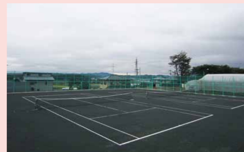
完成したテニスコート

○テニスコート完成… グランド東側 バックネットの裏にコート 2 面を整備しました。