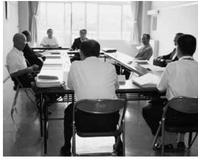
審査中の文教厚生常任委員会

〔議案第48号〕 矢吹町国民健康保険条例の一部を改正する条例 本案は、緊急の少子化対策として平成21年10月から平成23年3月までの出産に限り、現行の出産一時金35万円の支給額を39万円に増額するため所要の改正をするもの。 審査の結果、全委員異議なく可決すべきものと決した。