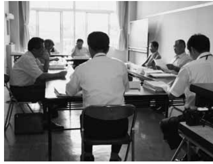
審査中の総務常任委員会