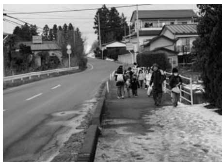
三神幼稚園前のカーブ

町長 県道石川く矢吹線における神田地区までの歩道整備は、今年度の上宮崎地区が完了予定です。白山地区では、白山団地手前まで今年度中に測量調査を行うことになっています。県道須賀川く矢吹線の三神幼稚園前の拡幅とカーブの解