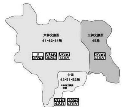
町内光回線の現況 (三神交換所は現在光・FLETSが提供されている。)