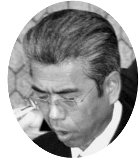
須藤 羊一 議員