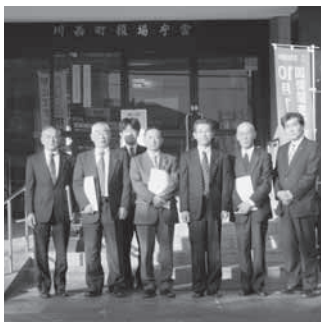
議会広報編集委員会

定例会一般質問終了後直ちに、編集日程や役割分担などを決定し、委員の皆さんが全面的に主体性をもって記事、執筆、編集等を担当し、短い期間の中でアドバイザーの方々と共に、町民に喜んで読んでいただける広報誌づくりに精進しているとのことでした。