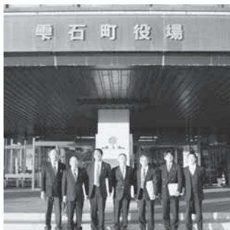
文教厚生常任委員会