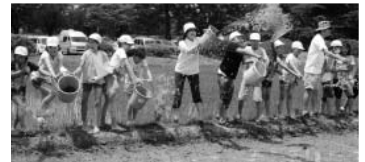
カブトエビの卵を放流