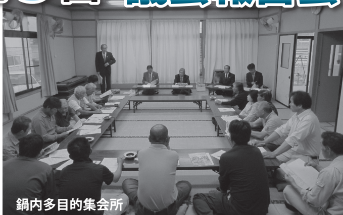
鍋内多目的集会所