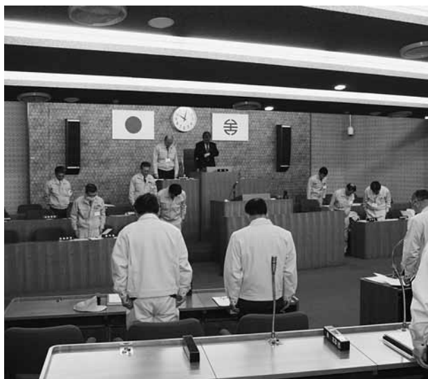
東日本大震災の犠牲者に黙祷