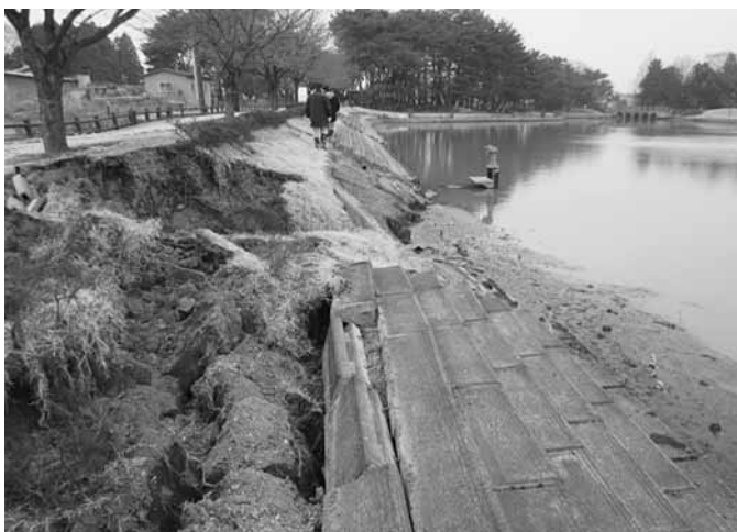
えん堤の崩壊 (大池公園)