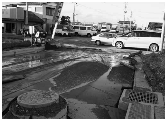
下水道マンホールの隆起(和田歯科前)