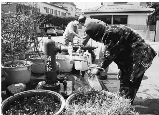
断水のため消火栓より水の供給(すずか商店前)