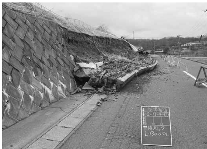
のり面の崩落 (丸の内工業団地)