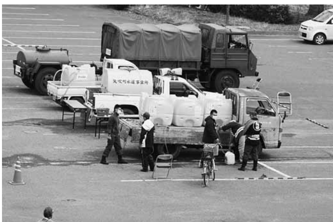
自衛隊と消防団による水の供給(役場)