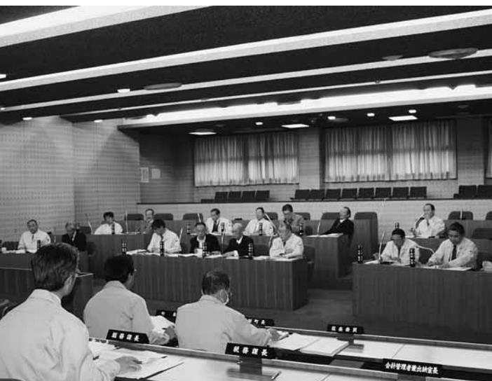
災害時のため作業衣で審議

〔第10号〕当町に立地希望の企業への奨励金の交付期間を3年間、限度額を3億円とする。