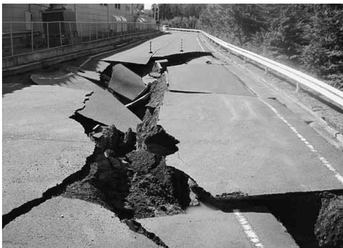
道路の陥没 (テクノパーク工業団地)