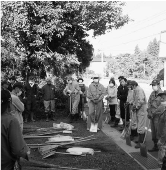
地域の除線活動の様子

Q 線量低減化活動支援 事業団体補助金につ いて、100団体で限度 額が50万円なのか。 A 1団体50万円で、100 団体を予定している。