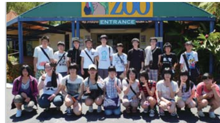
▲中学生海外派遣事業