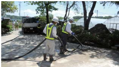
▲ 除染高圧洗浄作業