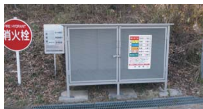
▲ 行政区活動支援事業ゴミ置場