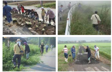
▲日本型直接支払交付金事業