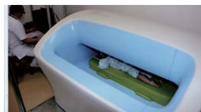
▲ ホールボディーカウンター検査事業 (ベビースキャン検査)