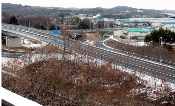
工業拠点として位置付けられる矢吹IC周辺

赤沢工業団地及び丸の内工業団地が所在し、その周辺にも工業集積に十分足り得る未利用地もございます。無秩序な開発を避けるためにも、当該地域への集積が先決と考えております。