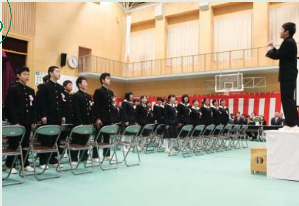
～第51回卒業証書授与式 矢吹中学校～