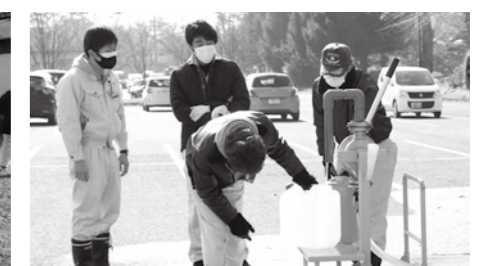
町文化センター給水所