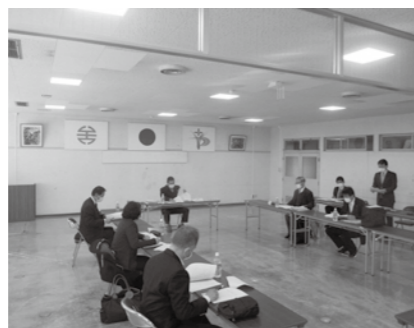
矢吹町都市計画審議会

また、同意にあたって、田町大池線に長年の要望である歩道設置について、子どもたちの安全のため早期実現を図ること、国道4号4車線化に伴う町道交差点の位置について、国と協議を行うことなどを求める意見書が提出されました。