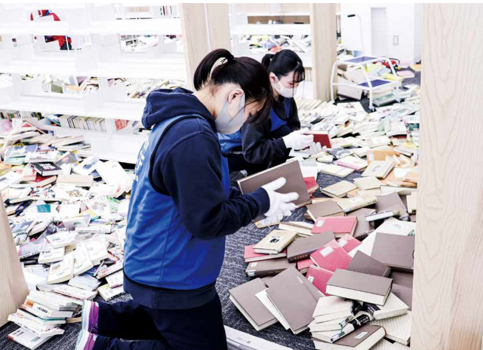
地震で床に落ちた本の整理を行うボランティアの高校生