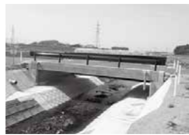
(位置：矢吹町大久保地内)

「矢吹町橋梁長寿命化修繕計画」に基づき、補修の優先順位が上位である橋梁(50号橋)の工事が完了しました。(国の補助事業(補助率55%))