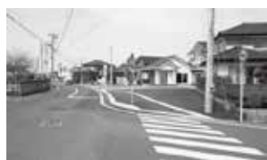
(位置：矢吹町小松地内)

交通量が多く、見通しの悪い危険な交差点(五差路)の一部区間において、歩道整備工事が完了しました。