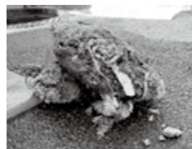
詰まった下水道管から出た油や髪の毛の塊