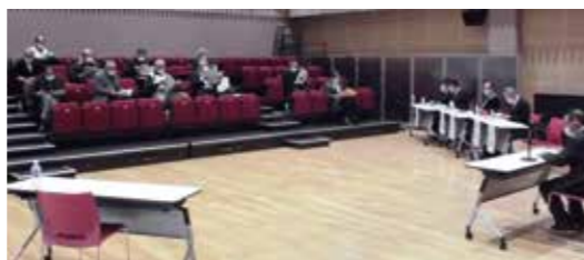
統計調査 総会の様子。

統計調査員に興味のある方は、役場まちづくり推進課 協働推進係までお気軽にお問い合わせください。 ☎ まちづくり推進課 協働推進係 ☎(42)2112