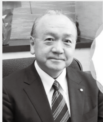
矢吹町長 蛭田泰昭

薫風香る時候、いよいよ田植えです。恵みの「雨」ごとに、そして軽トラ、トラクターが音を響かせて農道を慌たたく行き交うことに、田に水が入り、目映い陽光が煌めき、雲雀や蛙が歌う。