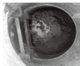
詰まった状態の下水道施設

また、最近では使い捨てマスクをトイレ等へ流す事例が全国的に問題となっております。前述の油と同様に、管の詰まりを引き起こす危険がありますので、使用したマスクは、ビニール袋等に入れ、口を縛って燃えるゴミとして捨てていただきますようご協力をお願いいたします。