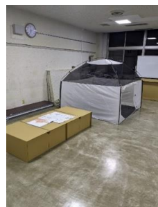
防災資機材 ダンボールベット・簡易テント