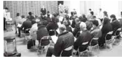
「意見交換会」の様子