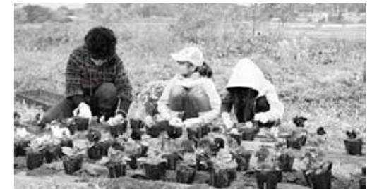
【旧こうすっぺ西側イメージアップ作戦 花の苗植えの様子】

このたび、これまで各団体が実施してきた取組や、活動への思いをポスターにまとめ、紹介しておりますので是非お越しください!