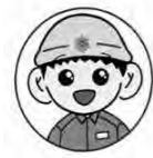
「救助隊員キュージーロー」