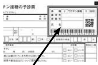
※3回目接種券は、予め予診票(右上)に印字されています