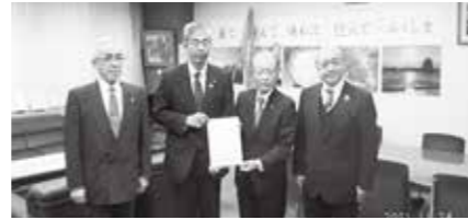
「県知事への要望書提出」の様子