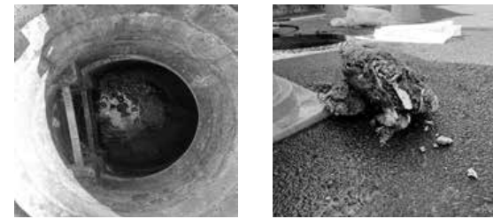
詰まった状態の下水道施設 詰まった下水道管から出た油や髪の毛

また、最近では使い捨てマスクをトイレ等から流される事例が全国的に問題となっております。前述の油と同様に、管の詰まりを引き起こす危険がありますので、使用したマスクは、ビニール袋等に入れて、口を縛って燃えるゴミとして捨てていただきますようお願いいたします。