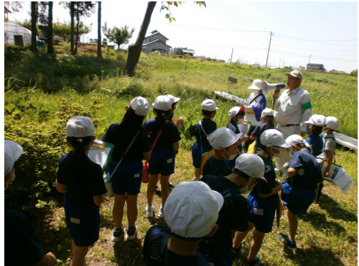
協力：大野康統推進員

学校より：自然豊かな矢吹町、歴史ある矢吹町ということ話を話していたき「矢吹町ってすごい」という思いを持つことができよかったです。