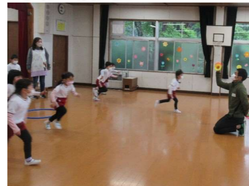
協力：光南高校 五十嵐教諭

園より：専門的な指導で分かりやすく、園児にとって親しみがわく存在となってくれました。