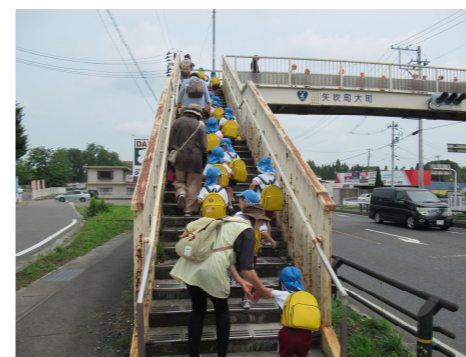
協力：地域住民の方3名