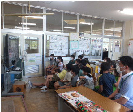
協力：(株)天乃屋 矢吹工場

学校より：DVDで会社の様子が分かり、子ども達からの質問にもたくさん答えていただき大満足でした。