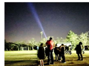
①三神小学校にて活動の様子

協力団体：ボランティア団体「おひさま」「きらきら」 中央公民館主催「読み聞かせボランティア養成講座受講生」 実施場所：複合施設 KOKOTTO マルチルーム 対象者：町内の小学生（1～3年生へチラシ配付）