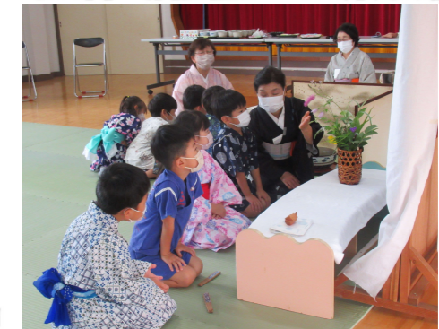
協力：矢吹町諸流茶道連合会

園より：感染予防の様々な工夫をしていただき、また季節感を感じさせながら体験できました。