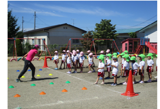
協力：教育振興課 千葉主事

園より：園児がイメージしやすい言葉で教えていただき、分かりやすく、大変有意義でした。