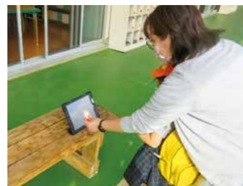
「QRコードをかざすと時間が記録されます」

今後もより良い教育・保育のため、保護者の皆さんとの情報共有、連携強化に努め、安心安全な幼稚園づくりを目指します。