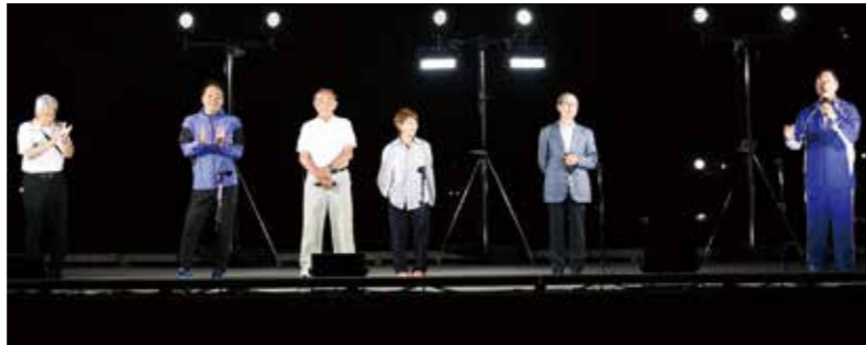
左から 井野修氏、楨原寛己氏、吉田孝司氏、宇津木妙子氏、王貞治氏、中畑清氏