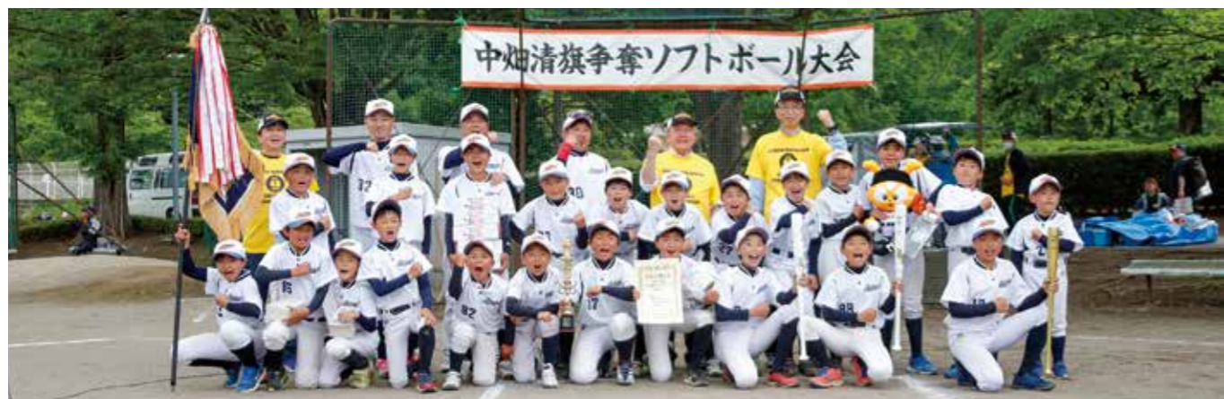
しゅんらんブロック優勝のALL矢吹スポーツ少年団