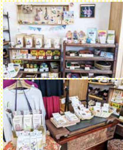
亀屋さんのフェアトレード商品

このようにフェアトレードは、SDGsの目指す「誰一人取り残さない」を実現するための有力な手段の一つです。今ではフェアトレードの認証機関も増えて様々なマークがありますが、買い物の際に、こうした認証マークがついている商品を選んで買うという行動がSDGsの実現につながります。