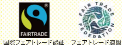
国際フェアトレード認証 フェアトレード連盟