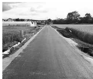
(位置: 文京町地内) 総延長 L=124.0m 幅員 W=2.5m

今回、文京町2号線、大池1号線、井戸尻1号線、大久保5号線の舗装工事が完了し、令和5年度は7路線が完了となりました。