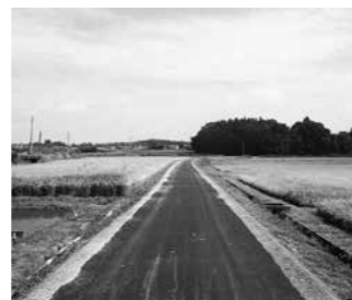
(位置: 大久保地内) 総延長 L=150.0m 幅員 W=2.5m