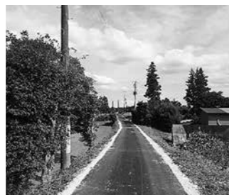
(位置: 大池地内) 総延長 L=243.0m 幅員 W=2.0~2.4m