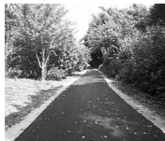
(位置: 井戸尻地内) 総延長 L=100.0m 幅員 W=2.5m