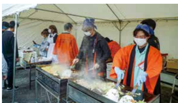
令和4年度櫛隆祭 模擬店の様子