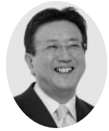
矢吹町長 野崎吉郎