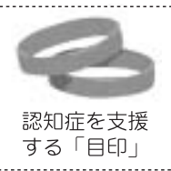
認知症を支援する「目印」

【申込方法】 ボランティアセンター（矢吹町社会福祉協議会）☎0248-44-5210 まで電話、または直接お申込みください。