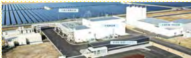
浪江町にある福島水素エネルギー研究フィールド https://www.env.go.jp/seisaku/list/ondanka_saisei/lowcarbon-h2-sc/events/PDF/shiryoku02.pdf