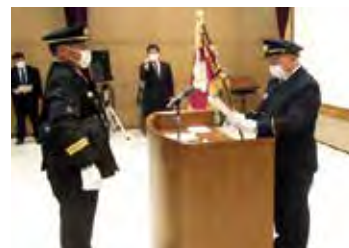
猪合団長辞令交付