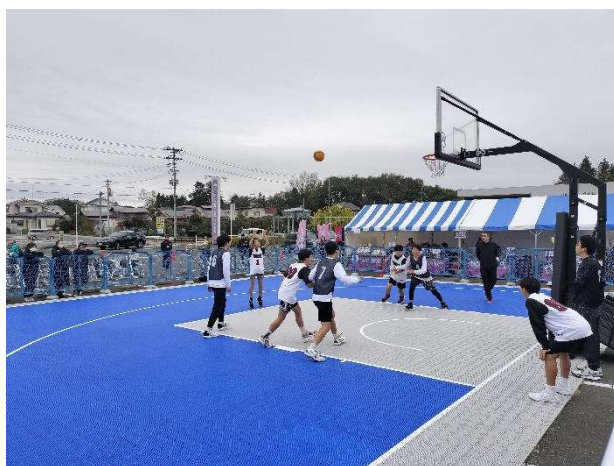
BONDS CUP 3x3 BASKETBALL in Yabuki