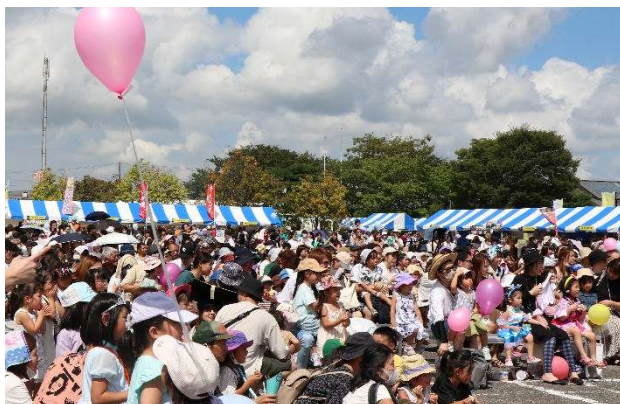
やぶきフロンティア祭り