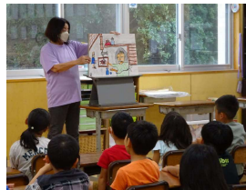
児童クラブ「読み聞かせ」