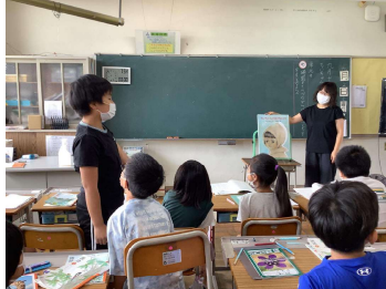
中畑小学校：国語科 読み聞かせ