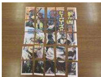
善郷小学校：読書パズル