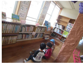
矢吹幼稚園：絵本コーナー