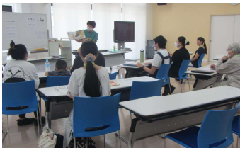
読み聞かせボランティア養成講座への協力