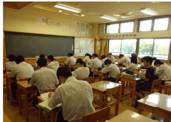
中学生：朝の読書タイム