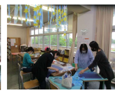
PTAによる図書室の環境整備