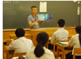
中学生：ボランティアによる読み聞かせ