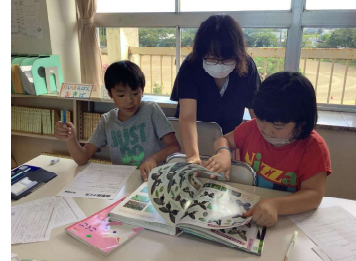
中畑小学校：図鑑の使い方