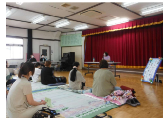
三神幼稚園：教育講演会