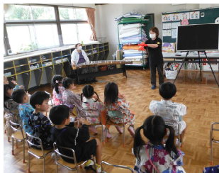
三神幼稚園：夏まつり