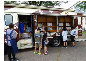
児童クラブ「移動図書館」