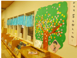
中学生：図書委員による掲示物