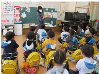
矢吹幼稚園：読み聞かせ