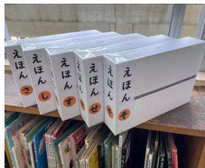
iPad 箱空き箱活用「分類表示箱」