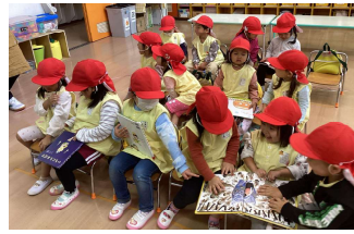
中央幼稚園：学級図書