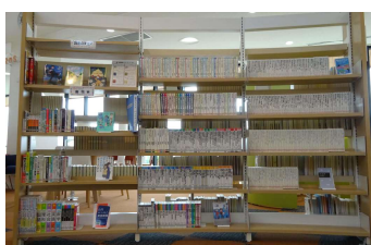
ティーンズコーナー