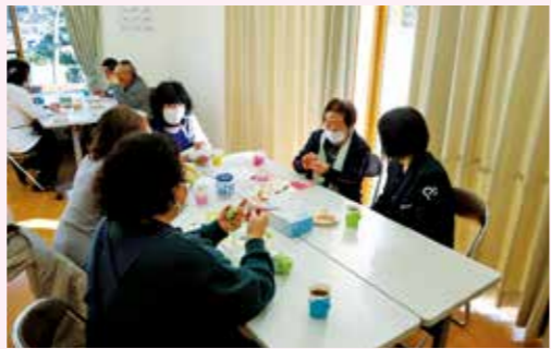
図 矢吹町地域包括支援センター ☎(44)5233