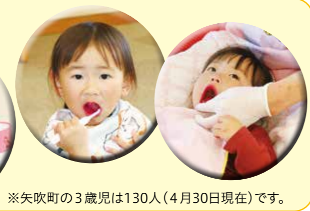
※矢吹町の3歳児は130人(4月30日現在)です。

※ 広報に掲載している毎月の現住人口は、県が公表する「福島県の推計人口」(国勢調査を基に算出)を転載しています。